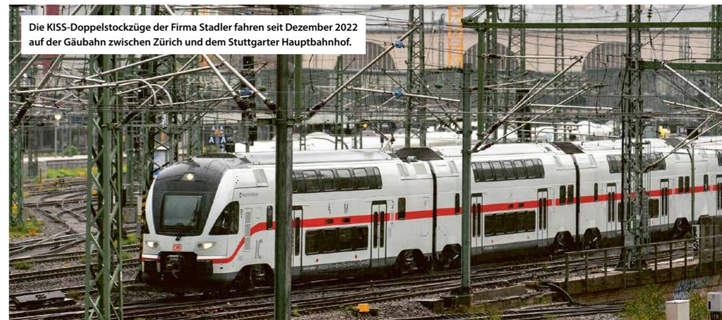
Die KISS-Doppelstockzüge der Firma Stadler fahren seit Dezember 2022 auf der Gäubahn zwischen Zürich und dem Stuttgarter Hauptbahnhof.

FAHRGASTVERBAND PRO BAHN STELLVERTRETENDER VORSITZENDER DES REGIONALVERBANDS STUTTGART