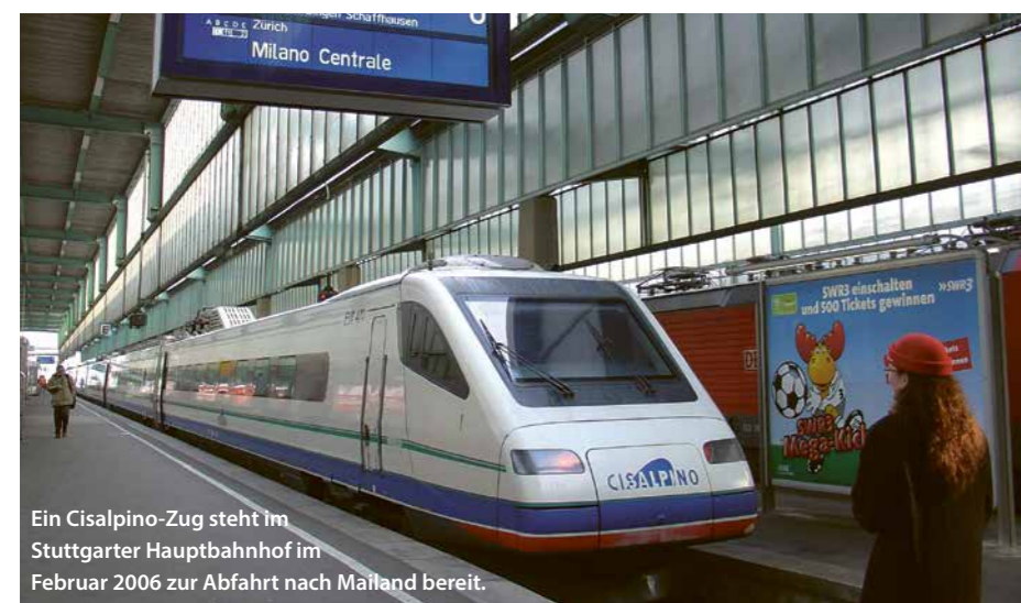
Ein Cisalpino-Zug steht im Stuttgarter Hauptbahnhof im Februar 2006 zur Abfahrt nach Mailand bereit.