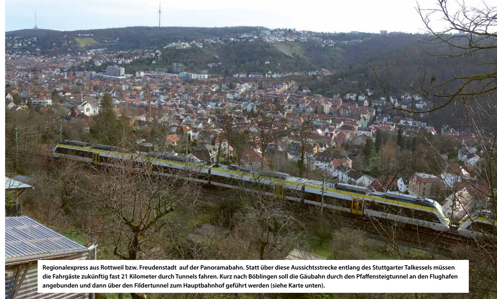
Regionalexpress aus Rottweil bzw. Freudenstadt auf der Panoramabahn. Statt über diese Aussichtsstrecke entlang des Stuttgarter Talkessels müssen die Fahrgäste zukünftig fast 21 Kilometer durch Tunnels fahren. Kurz nach Böblingen soll die Gäubahn durch den Pfaffensteigtunnel an den Flughafen angebunden und dann über den Fildertunnel zum Hauptbahnhof geführt werden (siehe Karte unten).

Im Juni 2020 wurde dann überraschend eine völlig neue Lösung präsentiert, bei der die Gäubahn über einen 11,2 Kilometer langen Tunnel von Böblingen direkt mit dem Flughafen verbunden werden